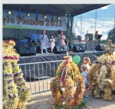
DOŻYŃKI GMINNE 2023 KARSKO, PLAC CYSTERSKI str. 13