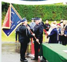
UROCZYSTOŚĆ NADANIA SZTANDARU DLA OSP W GIŻYNIE str. 15