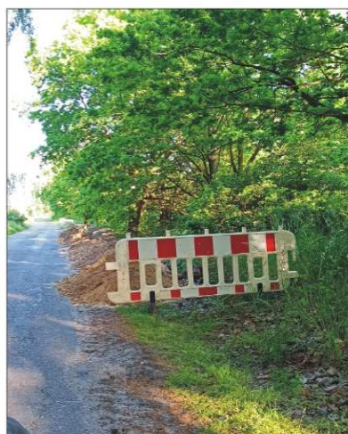
Wykonawcą robót jest firma PPUH SANBUD Sp. z o.o. z Gorzowa Wlkp.