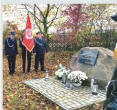
105 ROCZNICA ODZYSKANIA NIEPODLEGŁOŚCI str. 16