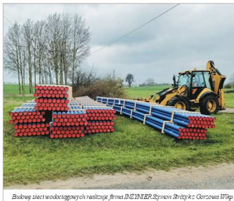
Budowa sieci wodociągowych realizuje firma INZYNIER.Szymon Strzyżek z Gorzowa Wlkp.

2 982 750,00 zł, z czego wodociąg Karlin-Giżyn 1 396 050,00 zł, wodociąg Karlin-Kinice 701 100,00 zł, wodociąg na osiedlu domków letniskowych w Kinicach 885 600,00 zł.